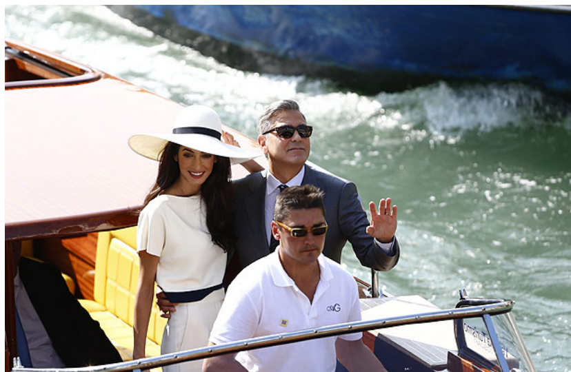
Casamento de George Clooney com a inglesa Amal Alamuddin em Veneza, em 2014